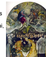
El Greko. Grāfa Orgasa guldišana kapā. 1586 g.