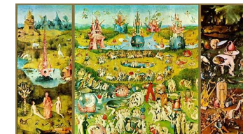
Hieronimuss Boss. Baudu dārzs. 1505 – 1510 g. Triptihs.