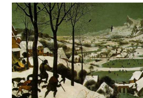
Pīters Brēgels Vecākais. Mednieki ziemā. No cikla "Gadalaiki". 1565 g.