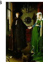
Jan van Eiks. Arnolfini saderināšana. 1434 g.