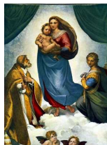
Rafaēls Santi. Siksta Madonna. 1515 – 1519 g.