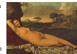
Džordžone. Dusoša Venēra. 1508 - 1510 g.