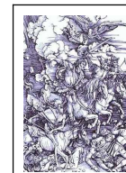
Dīrers. Četri jātnieki no sērijas Apokalipse. 1497 – 1498 g. Kokgrebums.