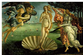
Sandro Botičelli. Venēras dzimšana. 1482 g.