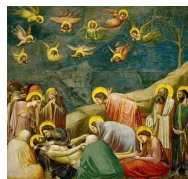
Džoto. Kristus apraudāšana. 1302 - 1305 g. Freska.

F. Brunelleski. Florences Sv. Marijas Ziedu katedrāles kupols. Ap 1420 - 1436 g.