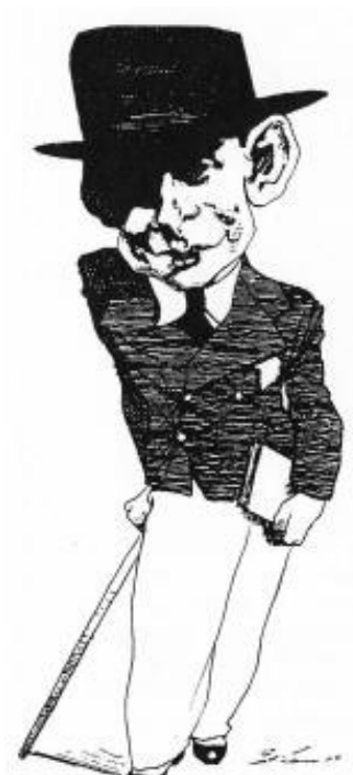
1. att. Tomss Skots Eliots ( http://zagarins.net/JG/jg217/JG217_Dzeja.htm )