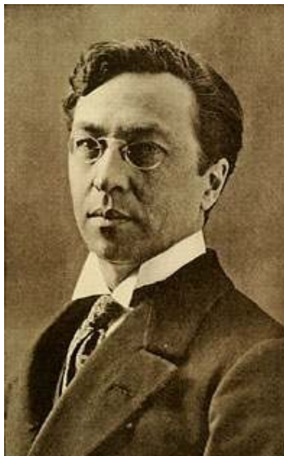
3.att. Vasilis Kandinskis, aptuveni 1913. gads ( http://en.wikipedia.org/wiki/Wassily_Kandinsky )

civilizācijas .2000., 434 lpp.) Krievu mākslinieks Vasilis Kandinskis (1866 – 1944) radīja pilnīgi abstraktu glezniecību, kurā krāsas un formas ieguva patstāvīgu netēlojošu nozīmi.