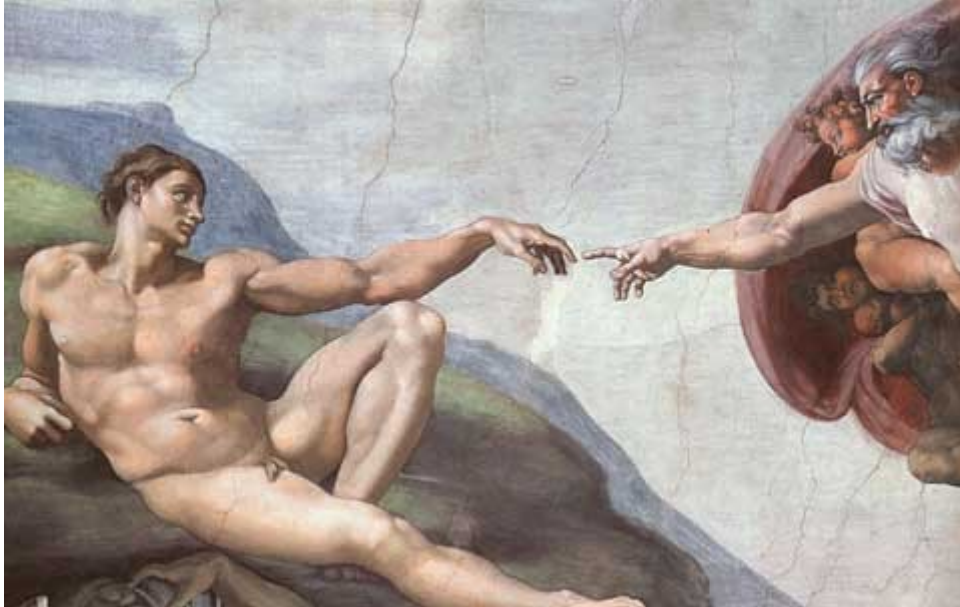
Radišana. Mikelandželo freskas fragments Siksta kapelā