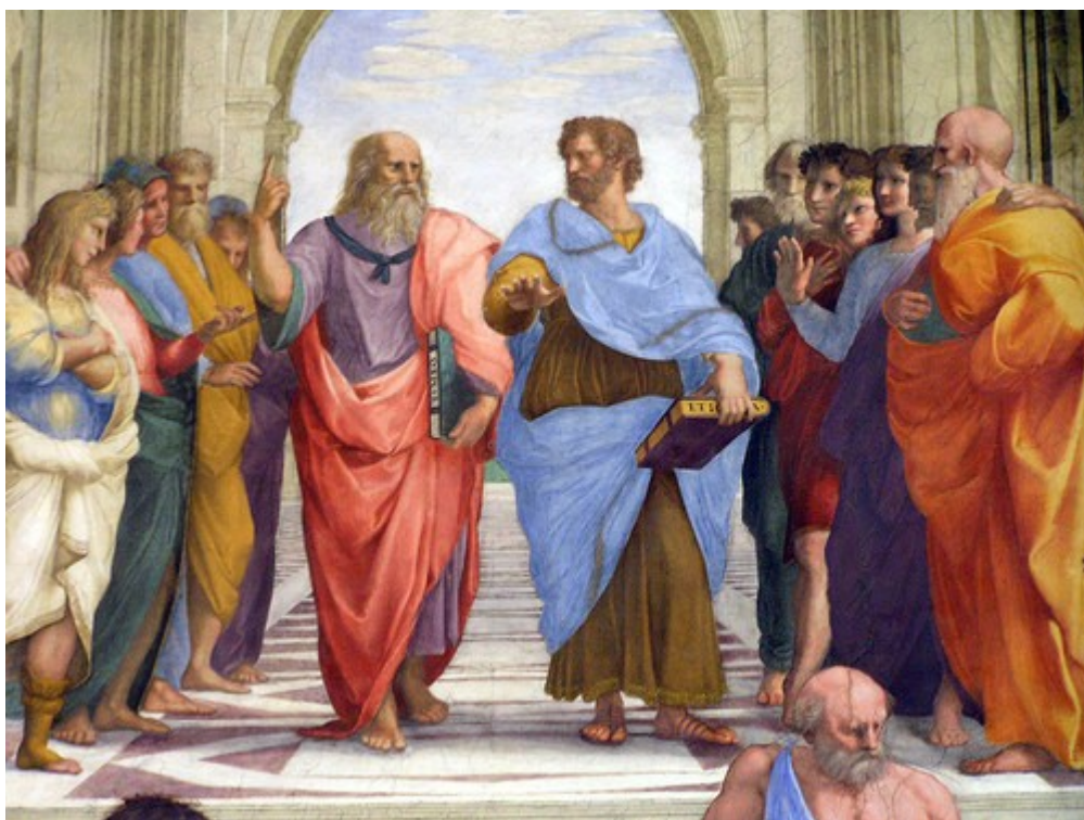
Rafaēls. Fragments no freskas „Atēnu skola”.