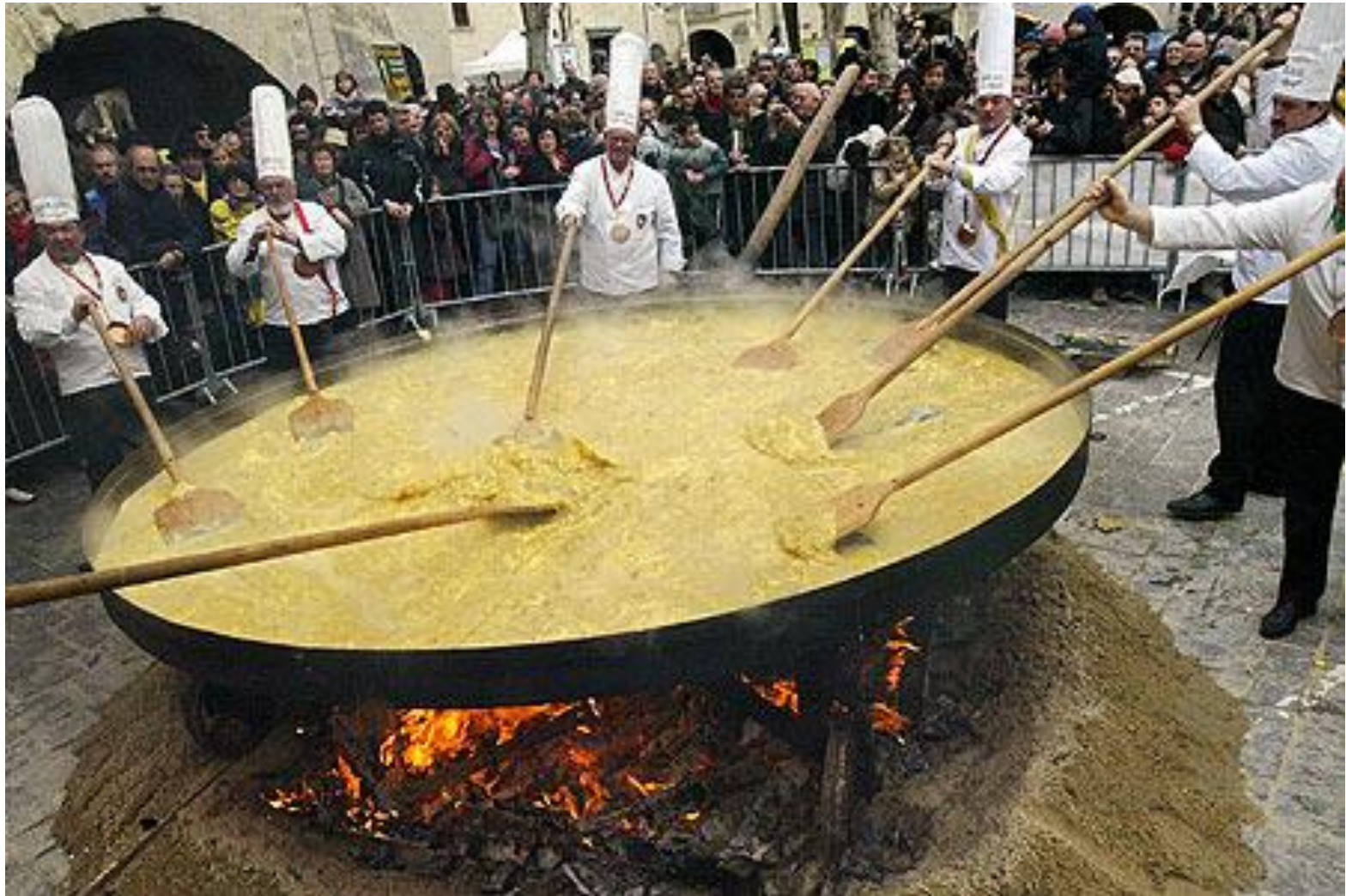
Tradicionālā Lieldienu kulteņa gatavošana Anglijā