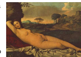
Džordžone. Dusoša Venēra. 1508 - 1510 g.