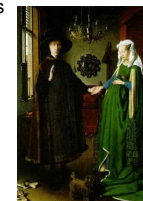
Jan van Eiks. Arnolfini saderināšana. 1434 g.