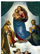
Rafaēls Santi. Siksta Madonna. 1515 – 1519 g.