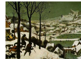
Pīters Brēgels Vecākais. Mednieki ziemā. No cikla "Gadalaiki". 1565 g.