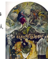
El Greko. Grāfa Orgasa guldišana kapā. 1586 g.