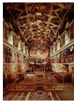
Mikelandželo. Siksta kapelas griestu gleznojums. 1508 – 1512 g.