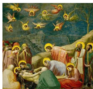
Džoto. Kristus apraudāšana. 1302 - 1305 g. Freska.

F. Brunelleski. Florences Sv. Marijas Ziedu katedrāles kupols. Ap 1420 - 1436 g.