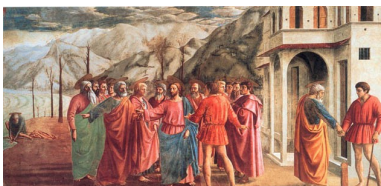
Mazačo. Brīnums ar nodevu grasi. 1425 – 1428 g. Freska.