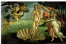
Sandro Botičelli. Venēras dzimšana. 1482 g.