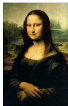
Leonardo da Vinči. Mona Liza (Džokonda). 1503 – 1506.