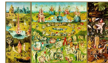
Hieronimuss Boss. Baudu dārzs. 1505 – 1510 g. Triptihs.