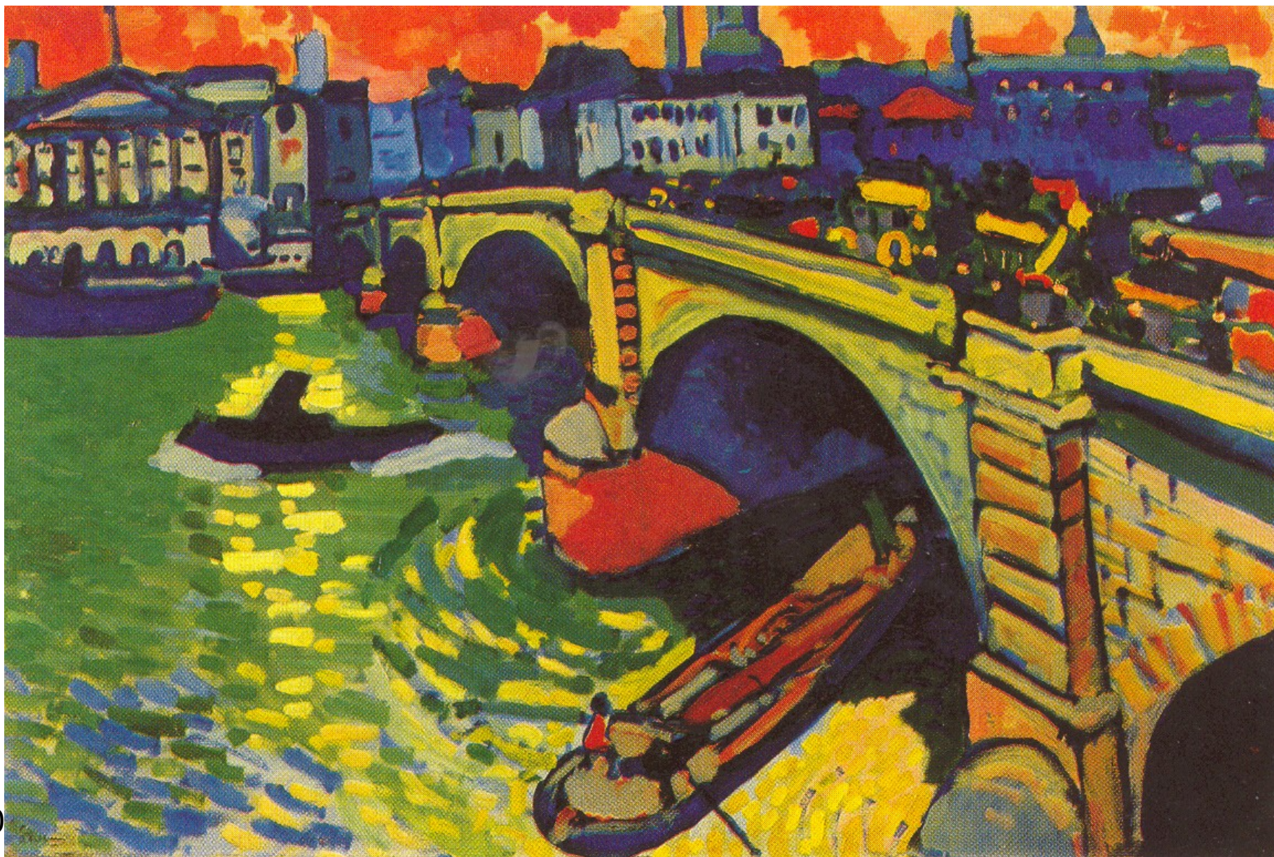
A. Derēns. Londonas tilts. 1906.