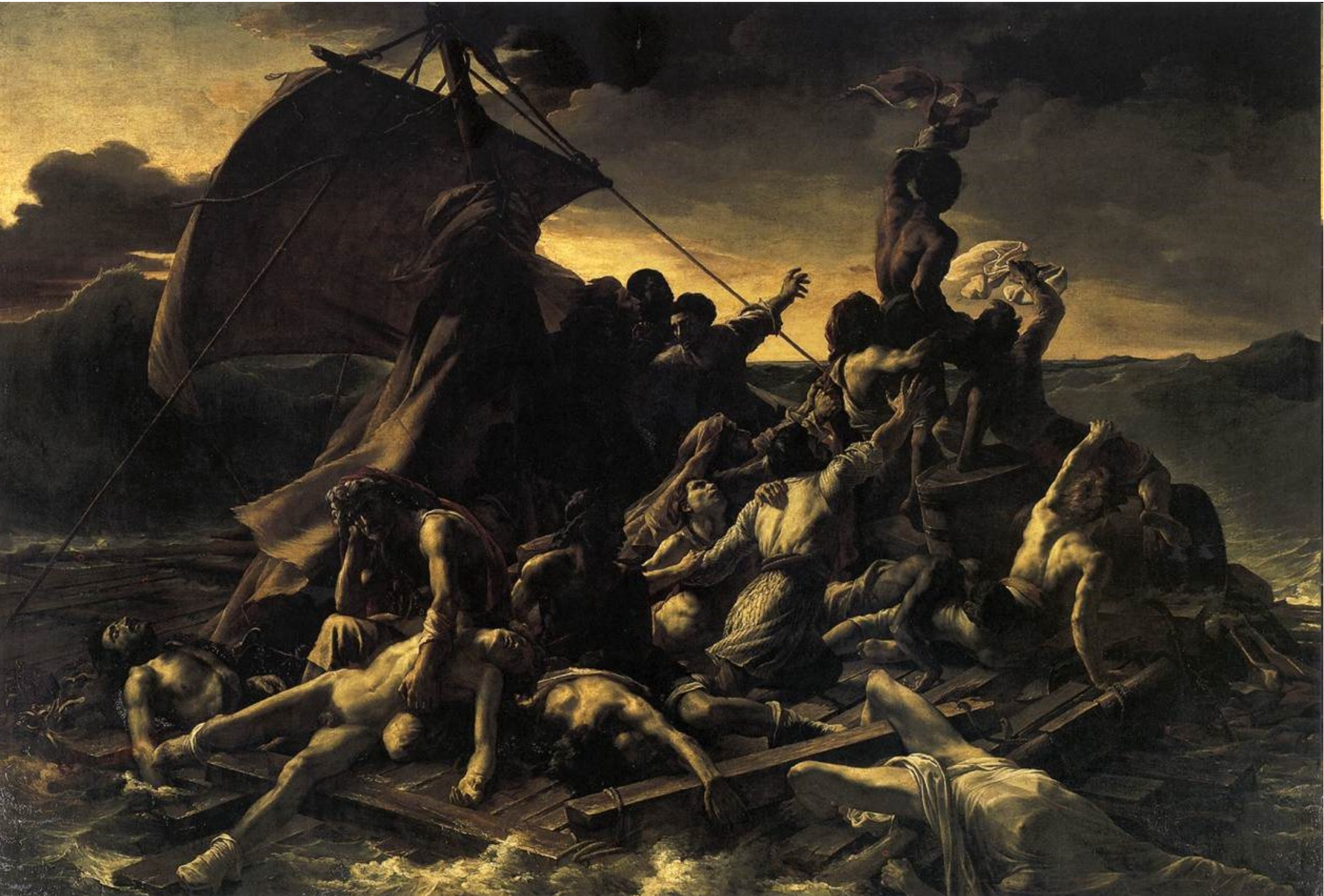
Žeriko. Medūzas plosts. 1818 - 1819.