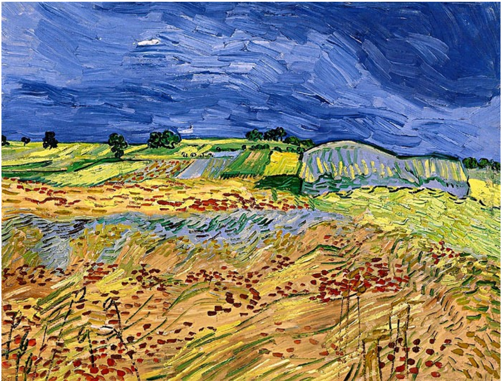
Van Gogh, (1853 – 1890) 2014