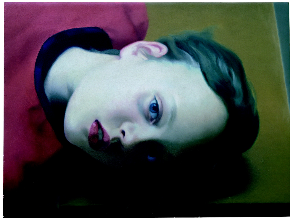
Leonardo da Vinči. Mona Liza. 1503. Vermērs. Meitene ar pērļu auskaru. 1665. Gerhards Rihters. Betija. 1977