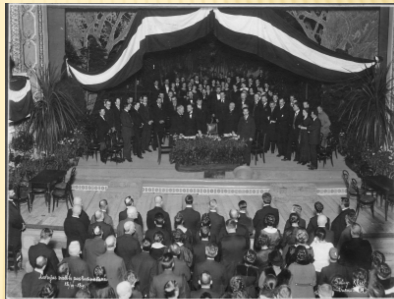
Latvijas valsts proklamēšana. Rīga, 1918. gada 18. novembrī