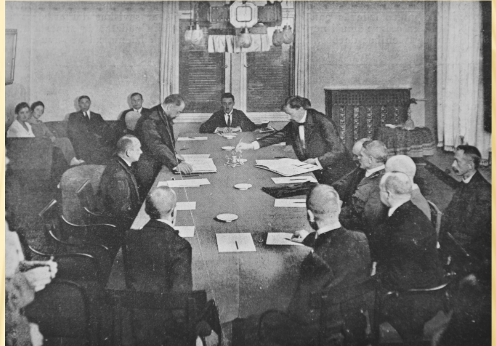
1920. gada 11. augusts – Latvija paraksta miera līgumu ar Padomju Krieviju