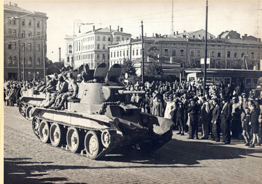
Sarkanās armijas ienākšana Rīgā. Krastmala pie autoostas, 1940. gada 17. jūnijs