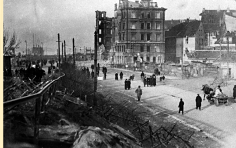
Latvijas Brīvības cīņas. Bermontiāde. Kara postījumi. Sagraudās ēkas Kārļa ielā. Rīga, 1919. gada novembris