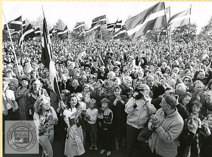
Mītiņš 11. Novembra krastmalā Rīgā pēc „Deklarācijas par Latvijas Republikas neatkarības atjaunošanu” pieņemšanas. 1990. gada 4. maijs