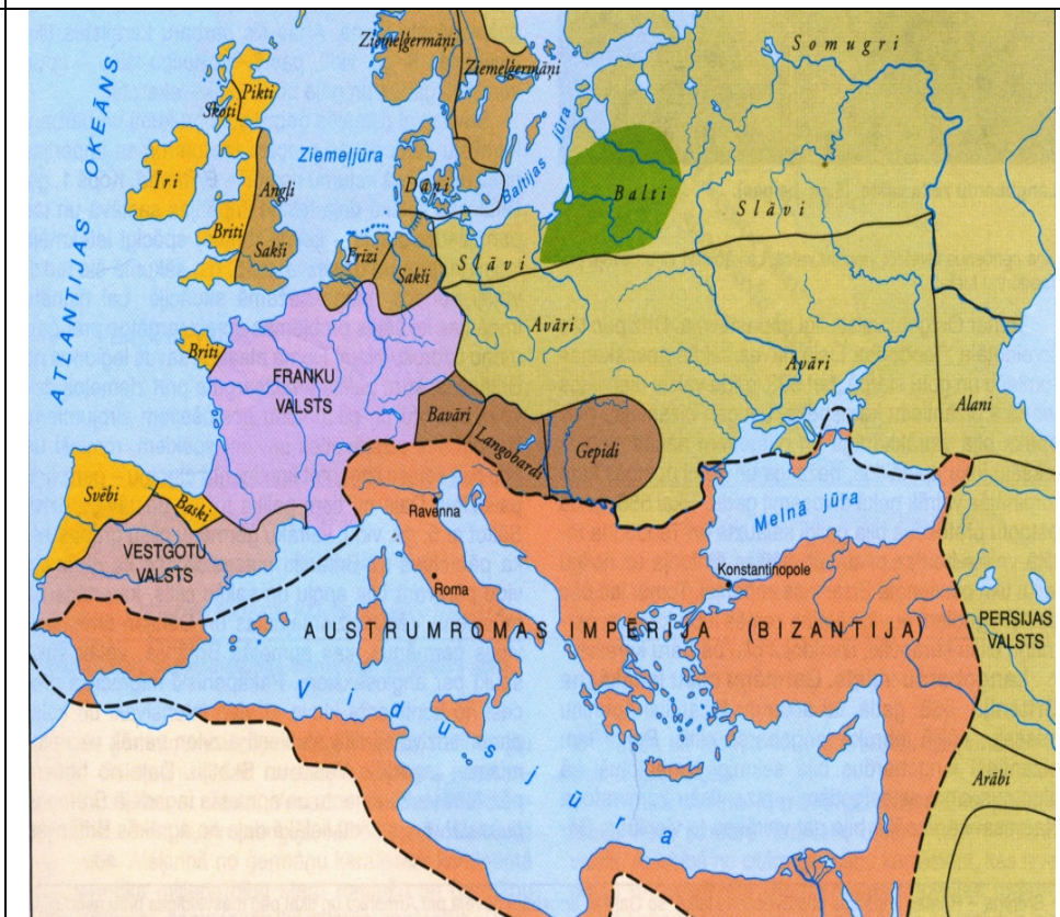
Barbaru karalistes un Bizantija ap 600. gadu.

(Pasaules vēsture vidusskolai. I daļa. Rīga, 2000. 249.)