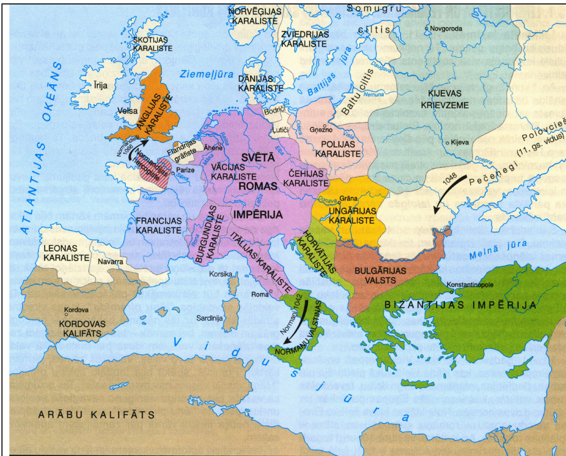
Ēiropa 11. gadsimtā.

(Pasaules vēsture vidusskolai. I daļa. Rīga, 2000. 275.lpp.)