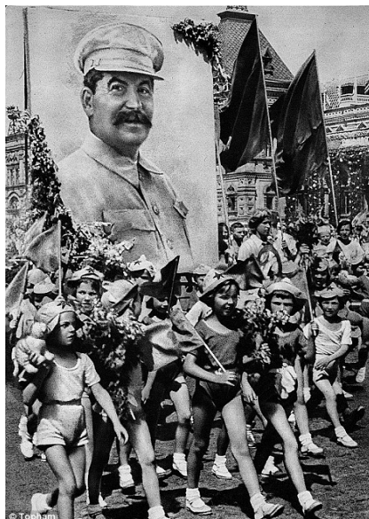
Svētku demonstrācija Maskavā.