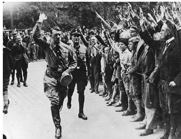
Ā. Hitlera tikšanās ar Vācijas iedzīvotājiem.