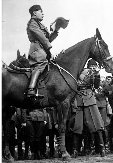
B. Musolīni uzruna.