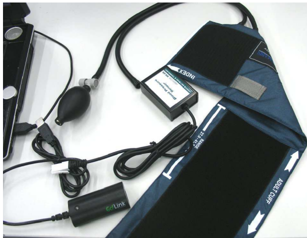
1. att. asinsspiediena sagatavots pieslēgšanai pie datora.