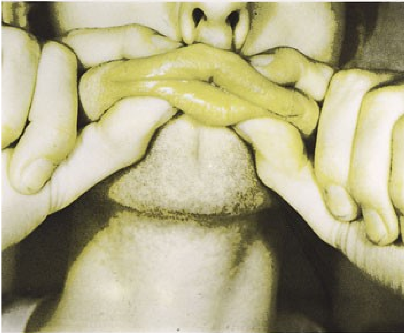
Hologrammu studijas Sietspiedes tehnika (serigrāfija) 1970