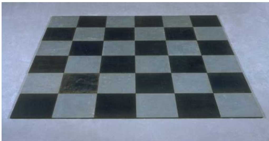
“Steel Zinc Plain “, 1969, skulptūra, 9 x 1840 x 1840 mm, Tate garerija Londonā