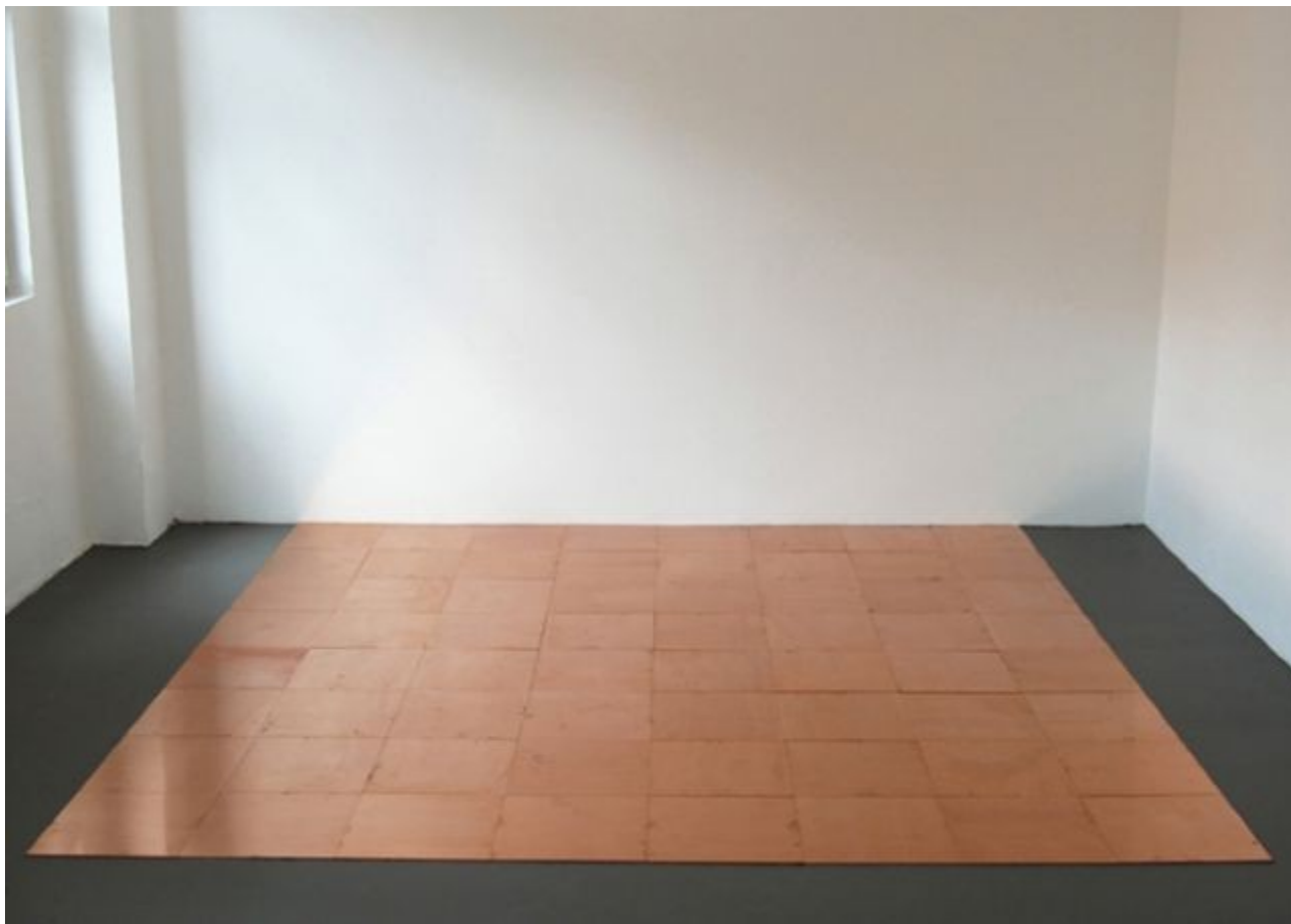
“Copper Square Eight “, 2008, instalācija, 0.5 x : 320 x : 320 cm, Konrāda Fišera galerija Diseldorfā