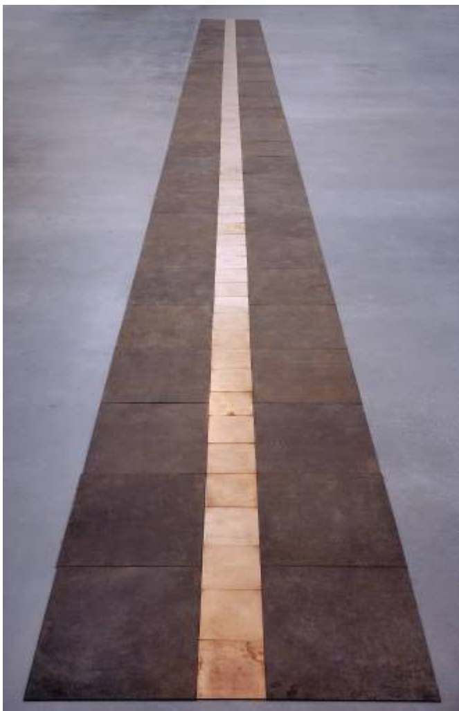
“Venus Forge”, 1980, skulptūra, 5 x 1200 x 15550 mm, Tate galerija Londonā