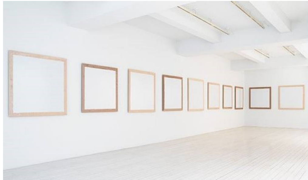
Robert Ryman "No Title Required" 2006

Elļas krāsas uz audekla, 7 paneļi 168 cm x 42 cm Šobrīd atrodas mākslinieka kolekcijā