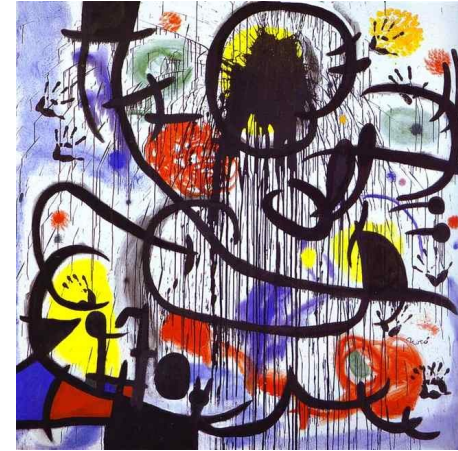
Miro Joan May 1968 (1973)