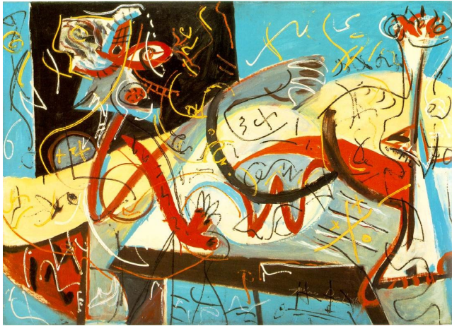
Stenogrāfiskā figūra (Stenographic Figure) 1942