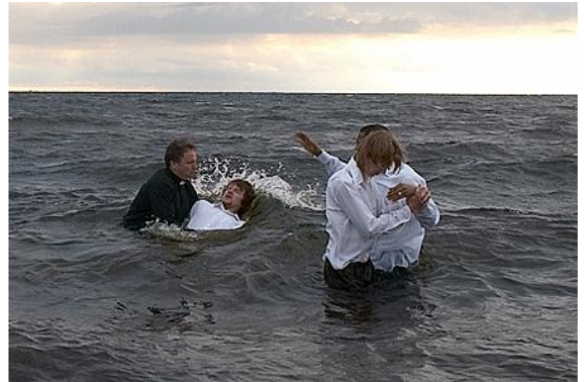
Kristīšanas rituāls jūrā