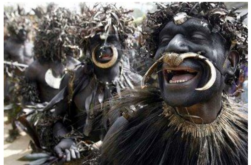
Sambia cilts iniciācijas rituālā dejas Papua Jaungvinejā