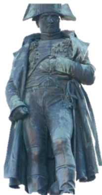
Napoleons Bonaparts (1769-1821) Francija