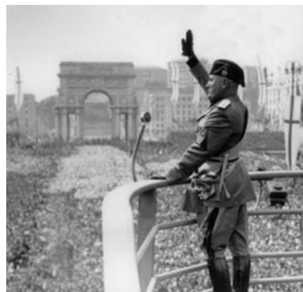
Benito Amilkare Andrea Musolīni (1883-1945) Itālija