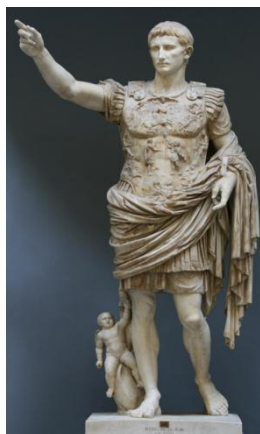
Oktaviāns Augusts 63.g.pr.Kr.-14.m.ē. Senā Romā

[11] Zīmes – tēli, kas atklāj tā lietotāja iekšējo stāvokli un nodarbošanos, laikmeta kultūras varonis vai cilvēka portrets var kļūt par zīmi.